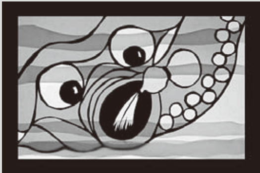
NPO法人創る村/出演作品「野々島の大ダコ」

活動サポートセンター) 入場料/無料 (フェスティバルの詳細は随時、すぎのこホームページにアップします) http://www.suginoko.org 主催/公益財団法人すぎのこ芸術文化振興会 共助/NPO法人創る村・台湾新興閣掌中劇団