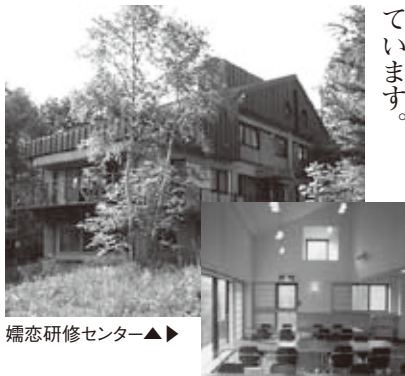
婦孺研修センター

県に日本宝くじ協会の助成により建設された「すぎのこ飯能研修センター」があります。いずれの施設も緑ゆたかな自然に恵まれ、大変静かな環境に立地しています。