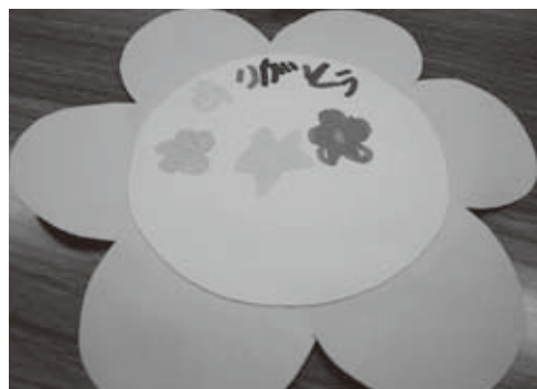
佐賀県唐津市昭和幼稚園より

毎年、とても楽しい時間を過ごさせてもらっています。劇の途中でも子ども達に声をかけたりにして下さるので、いつも最後まで子ども達が夢