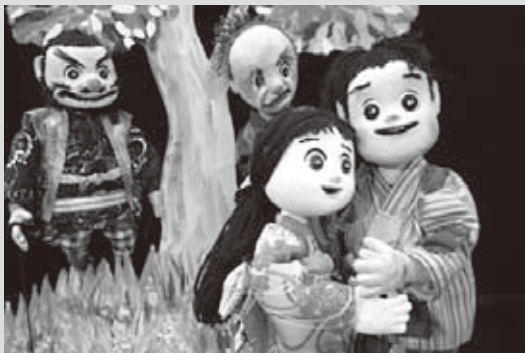
すぎのこ/出演作品「わらしべ長者」

活動サポートセンター) 入場料/無料 (フェスティバルの詳細は随時、すぎのこホームページにアップします) http://www.suginoko.org 主催/公益財団法人すぎのこ芸術文化振興会 共助/NPO法人創る村・台湾新興閣掌中劇団