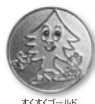
すくすくゴールド

賛助会は、すぎのこの理念・目的に賛同する個人や団体の方々に、当財団の活動を側面から支援していただくものです。入会された方には、会員証と共に入会の証としてアンパンマンでおなじみのやなせたかし先生がデザインした、すぎのこ「すくすく」バッジ(写真)をお贈りいたします。