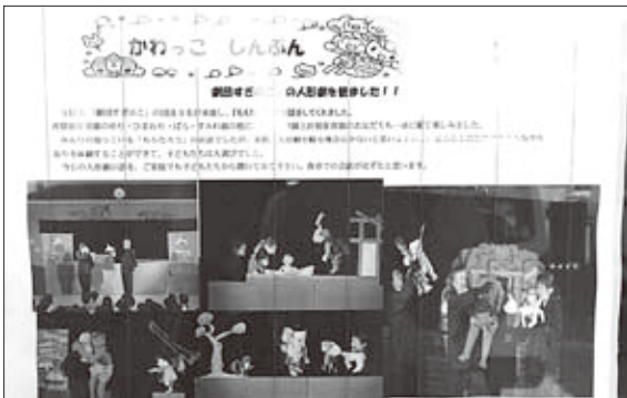
▲新潟県佐渡市河原田保育園より

「三まいのおふだ」と「大きなかぶ」、どちらも子どもたちが引き込まれていました。一つ目のお話から二つ目のお話をする前の準備も、子どもたちが飽きないようなやり方で、とてもよかったです。