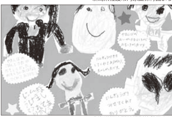
▲北海道標津郡計根別幼稚園より