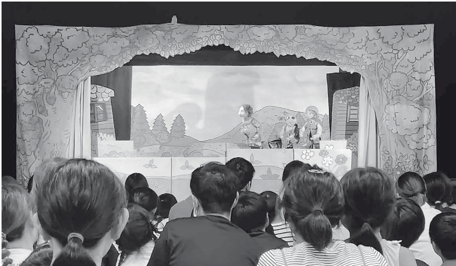
「金のおの銀のおの」いいだ人形劇フェスタ2025に於いて

http://www.suginoko.org/ E-mail: support@suginoko.org