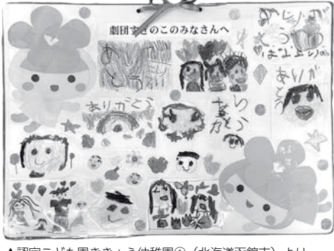
▲認定こども園さきよう幼稚園①(北海道函館市)より