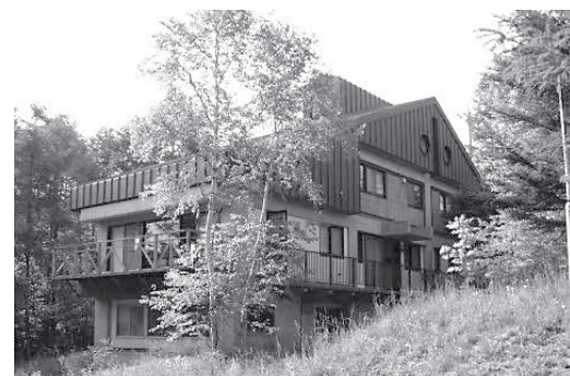
婦恋研修センター

KA)の補助により建設された「すぎのこ山荘」と日本宝くじ協会の助成により整備された「わんぱく村」からなる「すぎのこ婦恋研修センター」があります。