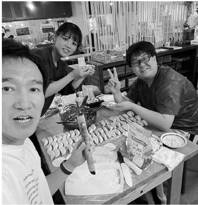
旅先にて 巡回班メンバーで餃子作り

初めての旅、初めての園での公演と、初めてづくしの1学期でしたが、無事に終えることができました。 実際に園で子どもたちに見ても